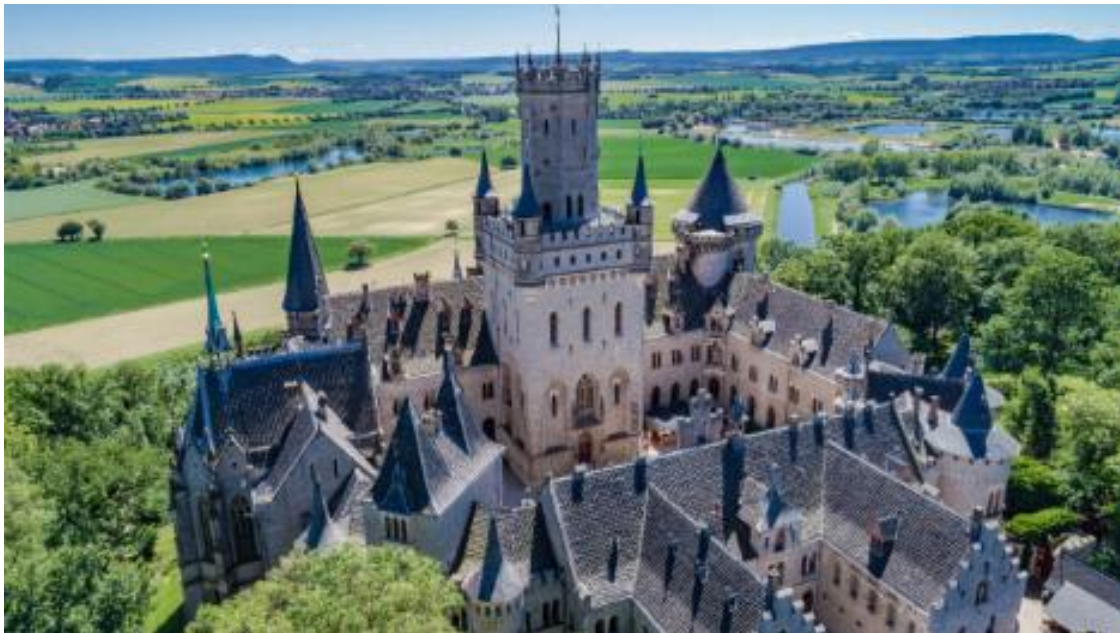
Das Schloß Marienburg aus der Luft

Artikel Von: JANA GODAU veröffentlicht am